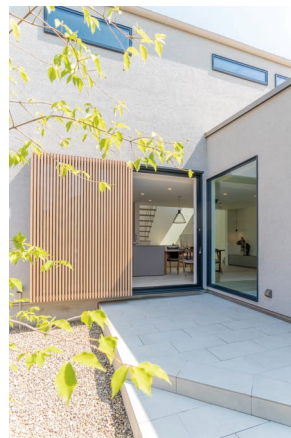
1階床面積 75.35㎡(22.79坪) / 2階床面積 41.40㎡(12.52坪) / 延床面積 116.75㎡(35.32坪)